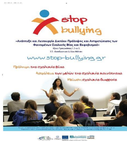
Η αφίσα για την Ανάπτυξη και Λειτουργία του Δικτύου