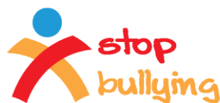
Το λογότυπο της Πράξης

Με δεδομένο ότι τα φαινόμενα της σχολικής βίας και του εκφοβισμού μπορούν να απειλήσουν τη σωματική και τη συναισθηματική ασφάλεια των μαθητών στο σχολείο και να αποτελέσουν αιτία εμφάνισης προβλημάτων τόσο στη μάθηση όσο και στη γενικότερη συμπεριφορά τους, το Υπουργείο Πολιτισμού, Παιδείας και Θρησκευμάτων υλοποιεί τις πράξεις « Ανάπτυξη και Λειτουργία Δικτύου Πρόληψης και Αντιμετώπισης των Φαινομένων Σχολικής Βίας και Εκφοβισμού », στον Άξονα Προτεραιότητας 1, 2 και 3., μέσω του Επιχειρησιακού Προγράμματος (Ε.Π.) «Εκπαίδευση και Διά Βίου Μάθηση», του ΕΣΠΑ 2007-2013, με κωδικούς ΟΠΣ 448089/448091/448093 για τα σχολικά έτη 2013-2014 και 2014-2015, στο γενικότερο πλαίσιο των πρωτοβουλιών του Υ.ΠΟ.ΠΑΙ.Θ. για την πρόληψη και την αντιμετώπιση της Σχολικής Βίας και του Εκφοβισμού (ΣΒΕ). Σκοπός των Πράξεων είναι η πρόληψη του φαινομένου της σχολικής βίας και η πρόνοια για την ασφάλεια των μελών της σχολικής κοινότητας μέσω προώθησης εξειδικευμένων δράσεων ενημέρωσης και ευαισθητοποίησης και επιμόρφωσης στελεχών εκπαίδευσης και εκπαιδευτικών.